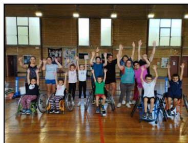
Vivement juillet 2024