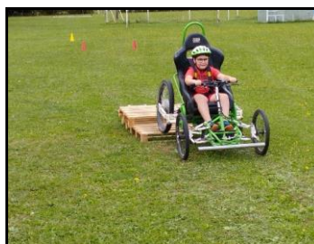
FTT (Fauteuil Tout Terrain)