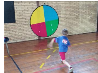
Choisir ta couleur, c'est gagné