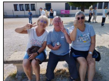
Challenge du 28 juin 2023