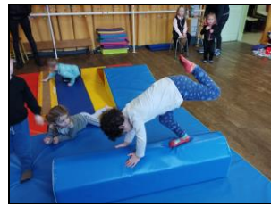
A 4 ans, sur une jambe