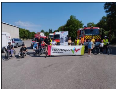
Départ place des Pompiers

Prochaine sortie le samedi 8 juin 2024, entre Froncles et Donjeux (Aller/Retour environ 30 km)