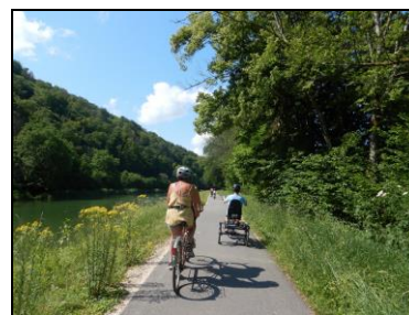
en Tandem ou en Tricycle Adapté