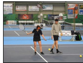
A Saint Dizier