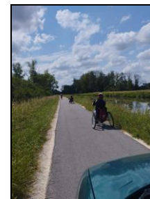
ou à la force des bras