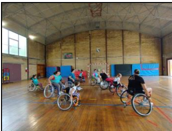
Sport collectif en fauteuil

Cet événement sera reconduit en juillet 2024 !