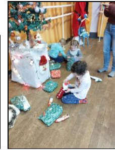
Les cadeaux du Père Noël