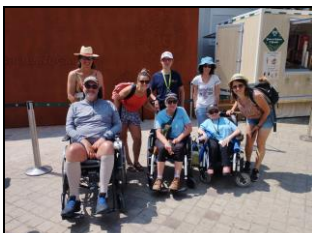
A Roland Garros 2023