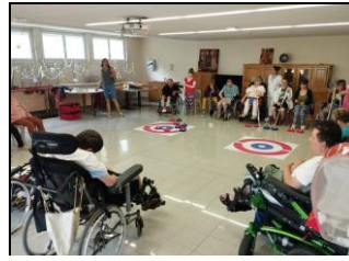
A Andelot - Rimaucourt