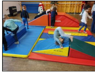
A 2ans ½, des roulades en avant et arrière