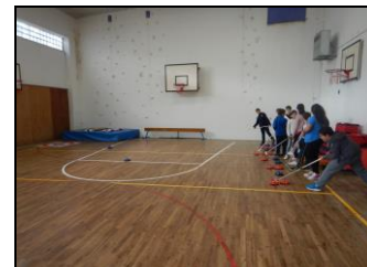
A Bourbonne les Bains