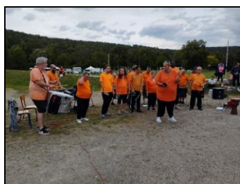
Batucada (ESAT Froncles / Breuvannes)

La quatorzième édition, aura lieu le jeudi 19 septembre 2024