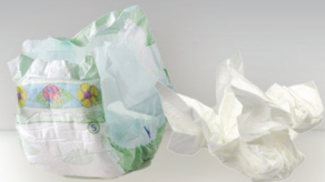
COUCHES ET TEXTILES SANITAIRES