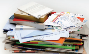
TOUS LES PAPIERS SE RECYCLENT