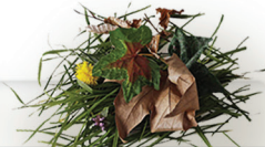
DÉCHETS DE JARDIN