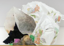
MARC DE CAFÉ, THÉ ET ESSUIE-TOUT