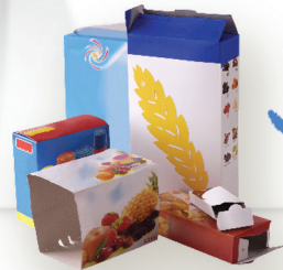
CARTONNETTES - CARTONS < à 50 x 50 cm